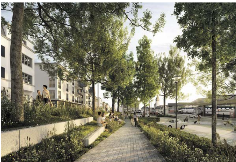
Gute Mischung: Sitzgelegenheiten für Menschen, Parkplätze für Autos.