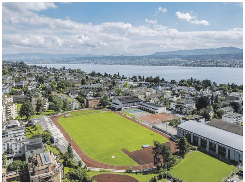
Standort Heslibach.