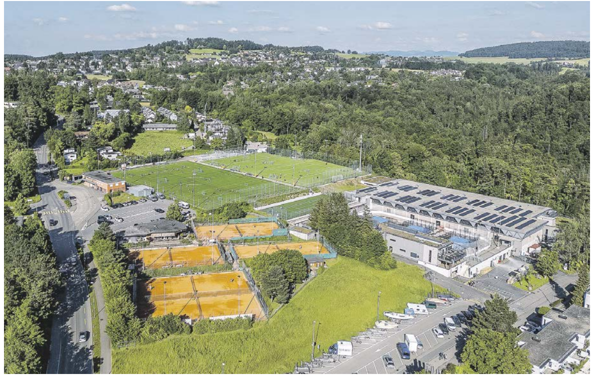
Standort Fallacher.

Eine erste Machbarkeitsstudie hat ergeben, dass eine Erweiterung der