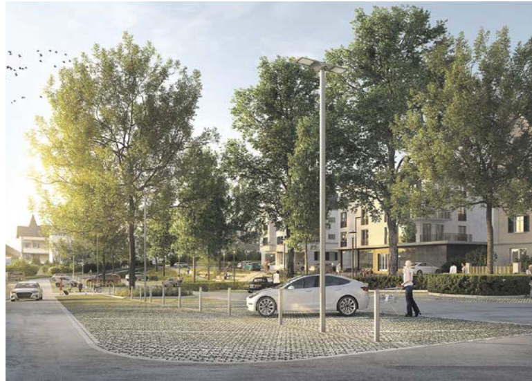
Schöne neue Parkwelt: Ein Platz für Autos aller Grössen, Menschen und Bäume.

In der amtlichen Publikation zur Projektfestsetzung war zu lesen, dass die Unterlagen ab Publikationsdatum 30 Tage lang bei der Gemeindeverwaltung im Bausekretariat für jeden öffentlich einsehbar aufliegen und auch auf der Website der Gemeinde abrufbar sind. Kurzer Rückblick: Das Projekt existiert gefühlt schon seit 20 Jahren. Damals dachte man über eine Überbauung nach, die den Platz beleben sollte, die Idee wurde aber schnell gebodigt. Bis im November 2023 wurde nach zweijähriger Bauzeit die Parkplatzsituation mit dem Neubau der SBB-Personenunterführung und der Velostation verändert. Das erste Vorprojekt zur Neugestaltung des Parkplatzes, der sanierungsbedürftig ist, aber ein Parkplatz bleiben soll, lag ebenfalls im November 2023 auf. Einwen-