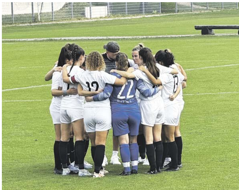
Bereits beim gemeinsamen «Einschwören» vor dem Spiel vermutete man, wie entschlossen der FCK auftreten würde.

Während vergangenen Sonntag Teams der Super League auf Provinz-Rasen von Vereinen aus tieferen Ligen abgeledert und aus dem Turnier geworfen wurden, lieferten die FC Küsnacht Frauen 1 (2. Liga) ab und schenkten dem FC Elgg-Wiesendangen (4. Liga) nichts. Es war bereits ab den ersten Minuten zu erahnen, welches Team den Platz in Elgg als Sieger verlassen würde: Schon in der vierten Minute zischte das Geschoss von Stähli auf den Kasten des Heimteams – vorerst schadlos. Doch schon fünf Minuten später trat Kamer einen ihrer gefürchteten Kurvneckbälle und setzte das Leder ins Netz. Trotz klarer Überlegenheit blieb das Resultat bis zur Halbzeit bestehen. Seitenwechsel nach der Pause, keine Verschnaufpause für die Elf von Elgg-Wiesendangen: Die Frauen von der Goldküste eroberten den Ball nach einem hohen Pressing bereits im gegnerischen Strafraum