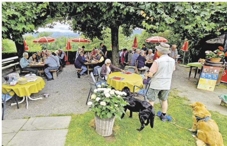
Eine fröhliche Runde – 50 Seniorinnen und Senioren und zwei Hunde auf der Blüemlisalp.

... wanderte zusammen mit weiteren Mitgliedern von der Küsnachter Allmend in gemütlichen Schritten und mit zwei Hunden zur Blüemlisalp ob Herrliberg.