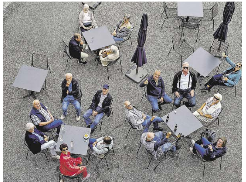
Gemüthlicher Apéro: Nebst Holzkühen gab es Verpflegung.

► Wer auch dabei sein möchte: www.kuesnacterseniorenverein.ch