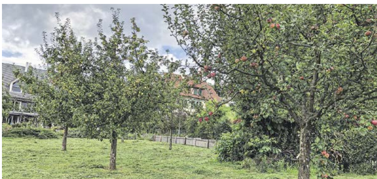
Apfelbäume auf der Zwingliwiese