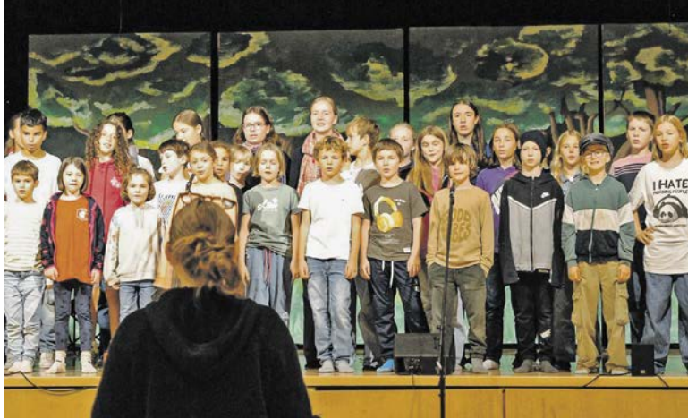
So ein Theater: Die Pfadis bei einer Probe.

Aufführungszeiten: Freitag, 24. Oktober, 19 Uhr Samstag, 25. Oktober, 13 Uhr Samstag, 25. Oktober, 19 Uhr ► Tickets: www.tickets.wulp.ch