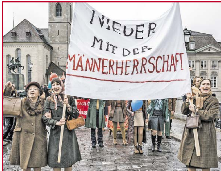
Szene aus dem Film: Demonstrationen auf der Münsterbrücke in Zürich.

KÜSNACHT. Töggelturnier. Im Zweierteam bestehend aus einem Kind (unter 16 Jahren) und einer erwachsenen Person wird um die Turniertrophäe gespielt. Für Verpflegung ist gesorgt