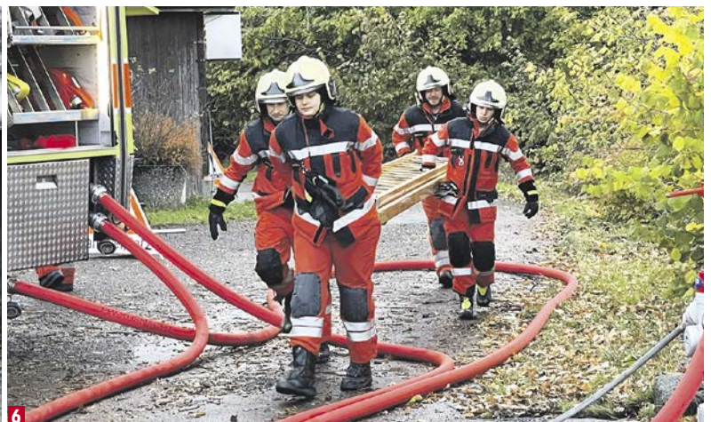
1 Feuer unterm Dach: Ein AdF mimt die zu rettende Person auf dem Balkon. 2 Wichtig: Das perfekte Anlegen der Maske stellt sicher, dass der AdF im Rauch frische Luft atmen kann. 3 Manöverkritik: Der Offizier (in Gelb) lässt sich die Abläufe erklären und korrigiert. 4 Kraft und Geschwindigkeit: Die richtige Wahl der Schläuche und Verteiler ist essenziell. 5 System: Das korrekte Auslegen der Schläuche soll verhindern, dass sich das Wasser darin staut. 6 Teamwork: Die schwere Holzleiter wird zur Rettung der Person über den Balkon gebraucht. Alu oder Kevlar wären leichter, würden aber der Hitze nicht standhalten. Befinden sich Personen höher als im 2. Stock, muss eine Autodrehleiter z.B. aus Zollikon angefordert werden. Küsnacht hat keine eigene.