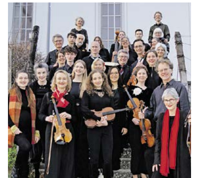
Das Kammerorchester Männedorf-Küsnacht

► Freitag, 7. November, 20 Uhr in der Ref. Kirche Männedorf und am Sonntag, 9. November, 17 Uhr in der Ref. Kirche Küsnacht. Eintritt ist frei.