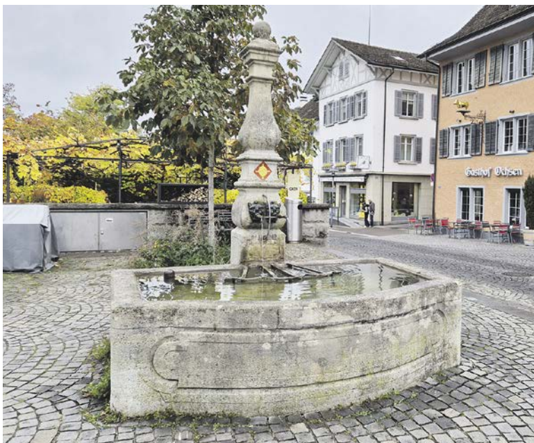
Der Brunnen auf dem Dorfplatz mit dem Küsnachter Wappen.

► Wer mehr über die Qualität unseres Trinkwassers wissen will, findet Informationen unter www.trinkwasser.ch .