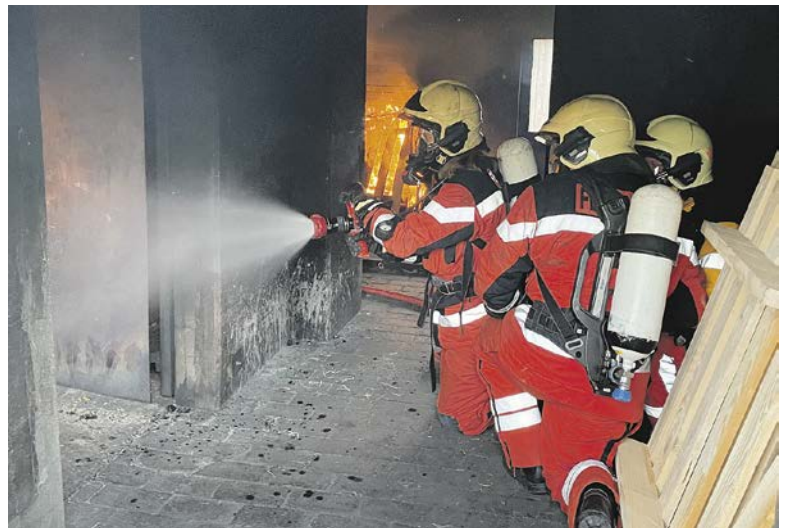
«Wasser marsch!»: Gezieltes Löschen heisst, im richtigen Moment die richtige Menge Wasser an den entscheidenden Ort zu bringen. (Bilder: dwe)

Mögliches Szenario: Ein Kochtopf hat auf einem Herd Feuer gefangen, das sich rasch ausbreitet, grosse Rauchentwicklung entsteht. Die Feuerwehr wird alarmiert und rückt Minuten später mit dem grossen Tanklöschfahrzeug aus. Zehn Feuerwehrleute inklusive Fahrer eilen zur angegebenen Adresse. Die Küche befindet sich im Erdgeschoss, das Fahrzeug kann nicht zur Eingangstür fahren, der Weg dorthin ist versperrt, Die Feuerwehr muss das Haus von hinten ansteuern. Die Männer und Frauen steigen vom Fahrzeug ab, einer läuft zum Haus, rekonosziert die Lage, sprintet zurück zur Mann- (und Frau-)schaft und berichtet. Schnell wird bestimmt, wie viele Meter welcher Schlauch ausgerollt werden muss (ein Schlauch misst 20 Meter). Inzwischen hat eine Angehörige der Feuerwehr (AdF) den Hydranten an der Strasse entdeckt, testet, ob er unter Druck steht und beginnt, ein Schlauchende anzuschliessen. Bei dieser Übung ist klar, dass keine Person gefährdet ist, eine Personenrettung muss also nicht erfolgen. Drei AdFs – zwei von ihnen üben, der dritte ist Ausbilder – schnallen sich die Pressluftflaschen um, mit