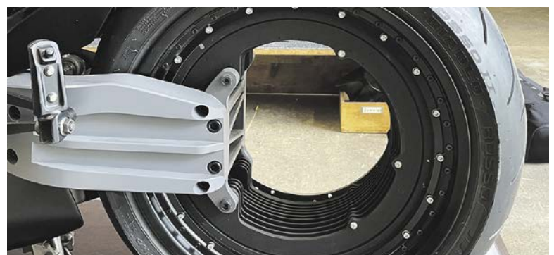
Der Radnabenmotor im Detail.