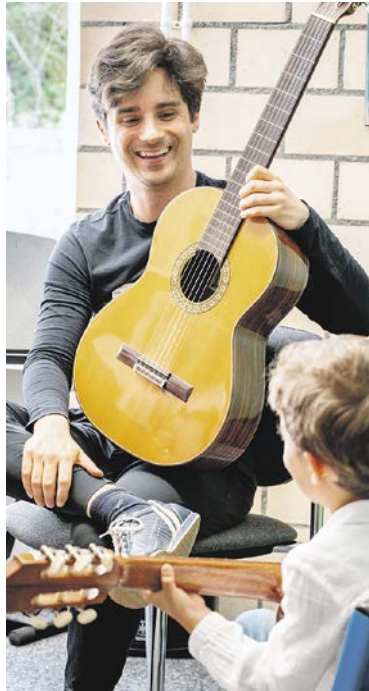
Kinder können jedes verfügbare Instrument ausprobieren.

► Jetzt buchen unter: www.musikschulekuesnacht.ch