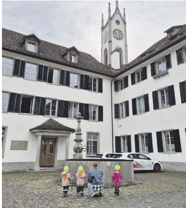
Der Seminarbrunnen im Hof der Kantonsschule plätschert seit 1781. Seit 244 Jahren ist er eine dekorative Wasserquelle.

Ende des 19. Jahrhunderts wurden die hölzernen Wasserleitungen – sogenannte «Tüchel», zwei Meter lange, längs durchbohrte Föhrenstücke – durch eiserne Röhren ersetzt. Brunnen mit guter Wasserqualität wur-