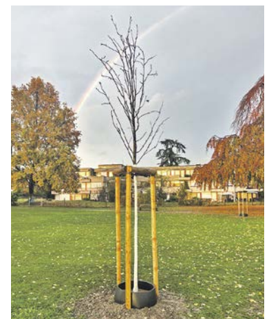
Die ersten von Tausend sind gepflanzt.

► Interessierte können sich unter baum@wirbleibendran.net melden oder weitere Informationen auf www.wirbleibendran.net finden.