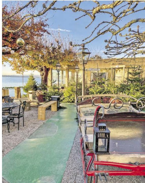
Vom Fondue-Pavillon hat man einen freien Blick auf den See. Tannen und Feuerschalen verwandeln den Garten in einen festlichen Winterwald.

Anstelle der beliebten Eisbahn lädt das Hotel nun ab heute, 13. November, zum Winterzaubergarten ein. Der Garten verwandelt sich dafür in einen festlich dekorierten Winterwald mit zahlreichen Tannen, Lichterketten, Feuerschalen und einem Märli-Pavillon. Herzstück ist ein Fondue-Pavillon mit Blick auf den See, der bis zu 45 Gästen Platz bietet. Für die kleinen Gäste gibt es Feuerschalen, an denen man mitgebrachte oder gekaufte Würste grillieren kann, sowie einen Märli-Pavillon mit einer eigens dafür geschriebenen Geschichte und einem Spielpfad. Neben Fondue werden auch Flammkuchen,