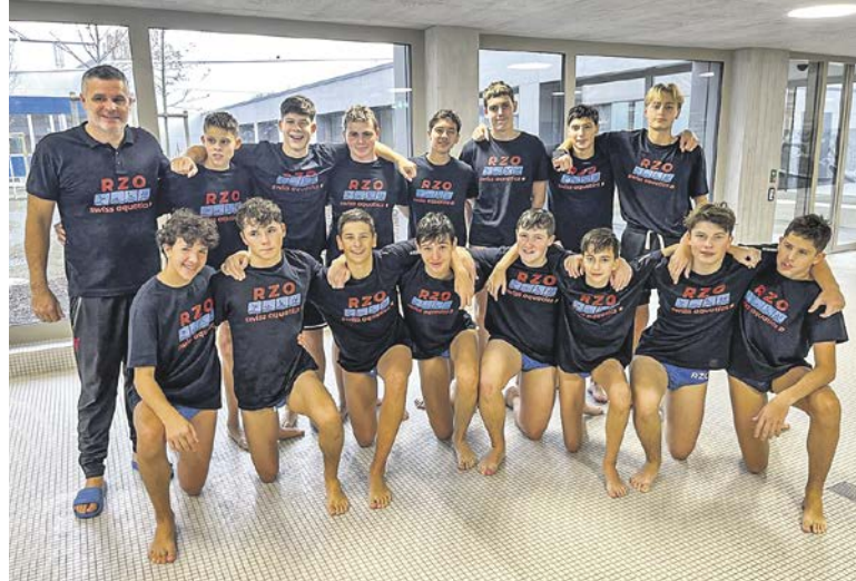
Die Besten von Küsnacht, Zollikon, Winterthur, Horgen, Zug, Ägeri und Zürich im Team der Region Zentral Ost RZO.