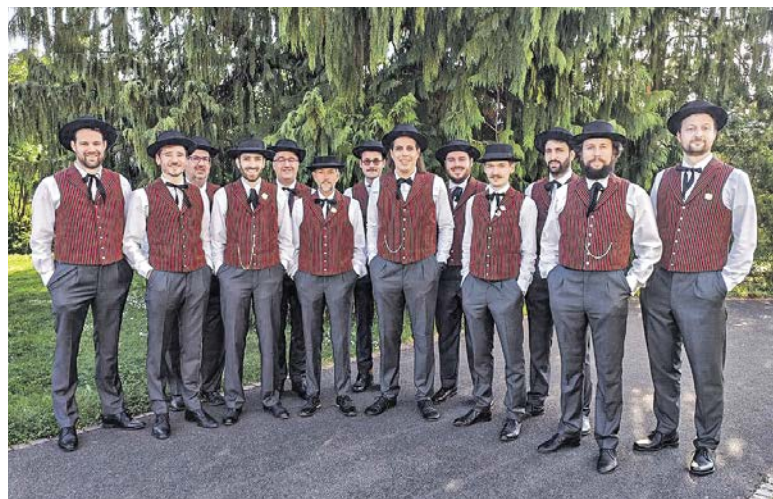
Jodeln als Hobby für Ältere? Nicht beim Jodlerklub Bergbrünneli, wo der Altersdurchschnitt auffallend tief ist.

Die Chormitglieder proben alle drei bis vier Wochen in Küsnacht und können die Proben so mit dem Studium oder der Arbeit vereinbaren. Immer wieder treten sie an Konzerten oder Jodlerfesten auf. 2022 erhielten sie am Nordostschweizer Jodlerfest in Appenzell gar die Höchstnote und gehören somit unter die Besten der Schweiz. Passend zur Ausstellung «Gemeinsam wirksam. Freiwilliges Engagement» zeigt der Chor am Mittwoch, 3. Dezember, um 19 Uhr im Ortsmuseum Küsnacht, was gelebtes Engagement heisst. An der öffentlichen Probe kann miterlebt werden, wie der