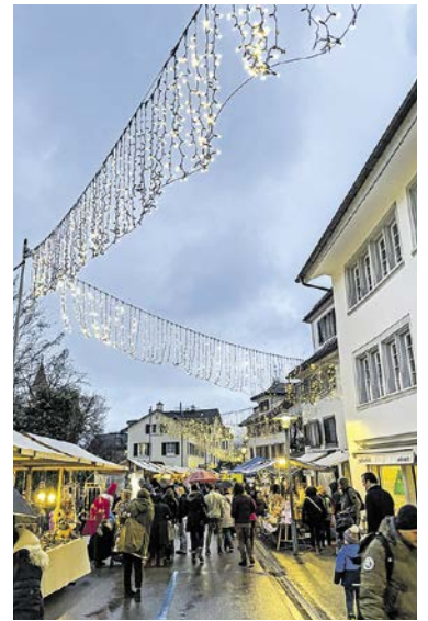
All überall: Weihnachtsbeleuchtung in den Gassen.