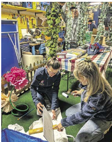
Basteln als Beschäftigung am Feierabend.

Die einen trinken ein Feierabend-Bier, die anderen sind bereits am Werkeln. In dieser Allrounder-Werkstatt treffen sich neben dem Höhli-Verein regelmässig auch eingemietete Parteien. So wie heute der Verein der Kinderfasnacht Küsnacht. Nicht etwa, um die Fasnacht selbst zu organisieren – dies sei