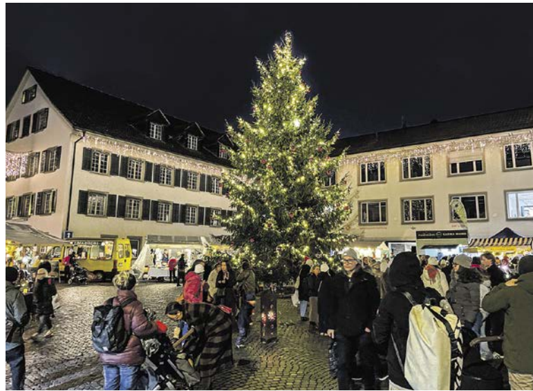
Einfach stimmungsvoll: Der Dorfplatz in adventlichem Tenü.