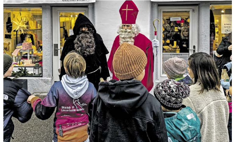
Da waren sie: Samichlaus und Schmutzli beeirten den Markt mit ihrem Besuch.