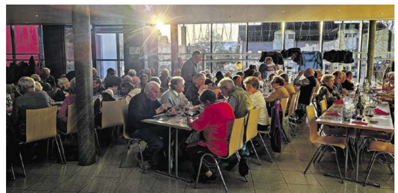
Stimmungsvoll: Eine sonnige Jahresschlussfeier.

► www.kuesnacterseniorenverein.ch oder info@kuesnacterseniorenverein.ch