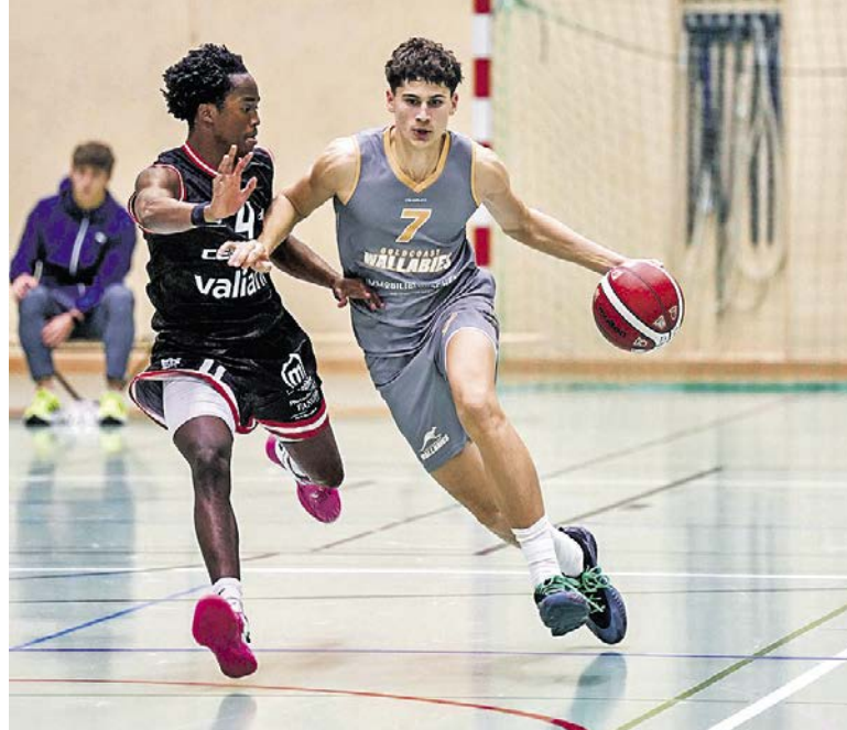
Dynamisch: Die B-Herren der Goldcoast Wallabies dribbeln sich zum Sieg.