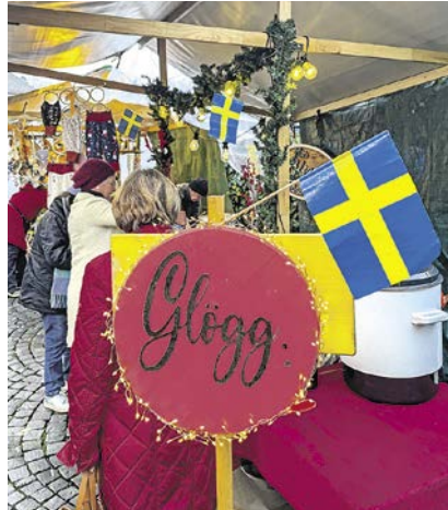
Heissgeliebt: Glögg oder Glühwein gab es in allen Variationen.

in Zumikon anfragen und das Defizit auffüllen können. Die Besucher erwarteten Hot Dogs bei den Küsnachter Kiwanern, Momos aus dem Tibet, heisser Punsch von der Feuerwehr Küsnacht, schwedischer Glögg, Schokolade in Variationen aus aller Herren Länder, Tiroler Speck, persische Snacks und die traditionellen Schweizer Leckereien wie Magenbrot und Raclette. In einem Zelt an der Kirche gab es Märchenstunden und Kerzenziehen, die Chrottegrötte war gefüllt mit Kindern, die Lebkuchen verzieren durften, und viele Vereine boten ihre in langen freiwilligen Stunden gestrickten, gebackenen und gebastelten Waren an. Überall zufriedene Gesichter und ein warmes Gefühl trotz Kälte. Vereinzelt gab es Kritik, ob man den Markt nicht lieber an einem Samstag bis in den späten Abend hinein stattfinden lassen könne, weil es dann dem lokalen Gewerbe weniger logistische Probleme bereite und die Gewerbetreibenden dann auch selbst den Markt entspannter geniessen könnten. Einwände, die es nicht zum ersten Mal gab im Vorfeld des Anlasses, der gesamthaft jedoch eine wunderschöne Gelegenheit mehr ist, im Dorf etwas miteinander bewegen zu können.