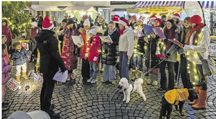
In höchsten Tönen: Adventssinger verbreiteten besinnliche Stimmung.