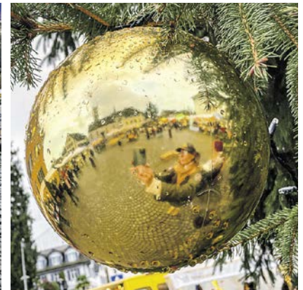
Glänzende Idee: Der Adventsmarkt ist für die Küsnachter ein «Must go».