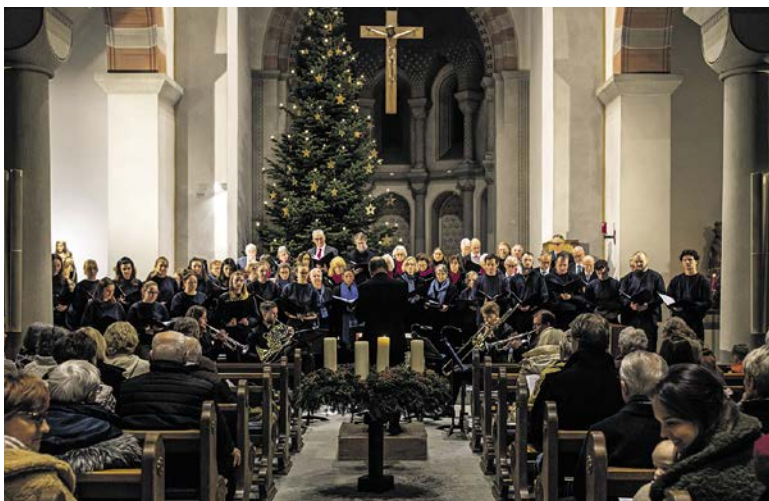
Traditionell: Weihnachtskonzert in der Kirche St. Georg.

Am Sonntag, 14. Dezember, findet in der katholischen Kirche Küsnacht das traditionelle Weihnachtskonzert der Chöre statt.