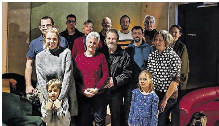
Gründungsfreude: Vorstand und neue Mitglieder des Quartiervereins «Itschne».

Ausgangspunkt dieser Initiative war das im April initiierte Projekt der Gemeinde Küsnacht «lokal vernetzt älter werden». Unter der Leitung einer engagierten Projektgruppe, mit tatkräftiger Unterstützung vieler Quartierbewohnerinnen und -bewohner, sowie beflügelt durch das erste Quartierfest im September mit gut 200 Teilnehmerinnen und Teilnehmern, wurden Bedürfnisse,