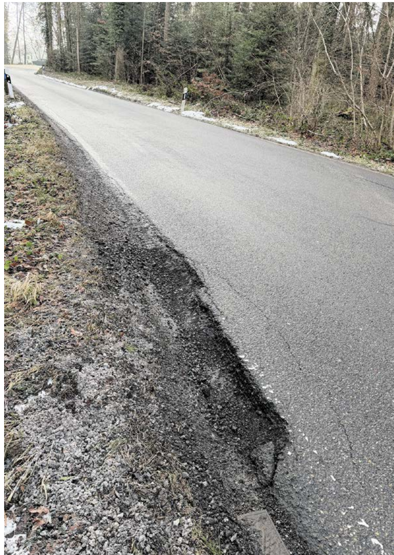
Stein des Anstosses: Ein Strassenschaden, der nicht ganz ungefährlich sein kann.

Im nächsten Schritt wird man aufgefordert, Beweismaterial wie zum Beispiel Fotos hochzuladen. Das System erlaubt maximal sechs Dateien. In unserem Fall reicht ein Foto. Im vierten Schritt wird man um eine Beschreibung gebeten. Wir geben unter dem Titel «Reifenkiller» ein: «Auf der Strasse zwischen Rumensee und Hohl-Gässli Fahrtrichtung Zollikon hat der Strassenrand einen gut zehn bis 15 cm tiefen Abbruch nahe einer Strassenmarkierung. Wer da mit den rechten Rädern reingerät, kommt eventuell ins Schlingern und läuft Gefahr, sich die Reifen aufzuschlitzen. Auf der Strecke, wo doch viele Automobilisten beschleunigen oder zu schnell unter-