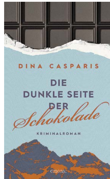
Leichte Kost: Ein neuer Gesellschaftskrimi mit kulinarischer Note.