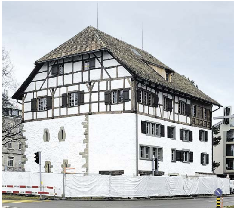
Ab Ende Januar beherbergt das Höchhus wieder die Gemeindebibliothek und die Galerie.

Die Bauarbeiten nahmen rund eineinhalb Jahre in Anspruch. Da