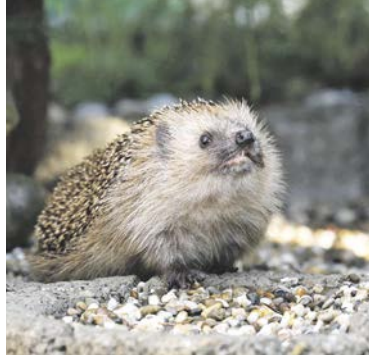
Tier des Jahres. Das freut das kleine Raubtier. Wahrscheinlich.

Wer derweilen an einer Party, einer Soirée oder bei entfernten Verwandten mit seinem Fachwissen