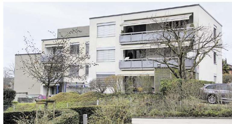
Eine Gemeindeliegenschaft an der Oberen Heselbachstrasse, die zu vergünstigten Konditionen vermietet wird. (Bild: dpl)

Vorrang haben Menschen mit Bezug zu Küsnacht: Wer bereits hier wohnt, hier aufgewachsen ist oder früher in der Gemeinde gelebt hat, wird ebenso bevorzugt wie Erwerbstätige mit Arbeitsplatz vor Ort. Voraussetzung ist, dass alle Bewohnenden ihren Wohnsitz offiziell nach Küsnacht verlegen. Personen, die bereits eine eigene Wohnung oder ein Haus besitzen, sind von der Vergabe ausgeschlossen. Schliesslich entscheidet auch die finanzielle Situation darüber, ob eine Bewerbung berücksichtigt werden kann. Bei einem Mietzins von bis zu