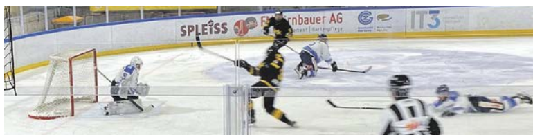
Die Playoff-Reise des SCK geht trotz Rückstand in der Serie weiter.