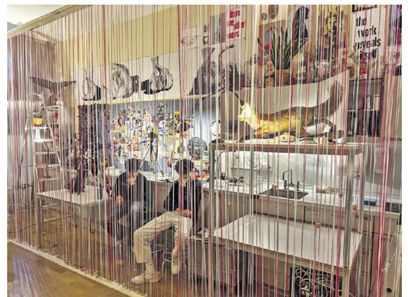
«So es Chrüsimüsi»: Die Installation/Performance der 3a thematisierte die Gleichzeitigkeit verschiedener Bewusstseinsströme.