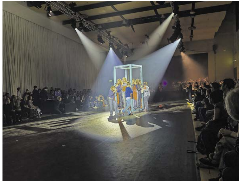
Eindrücklich: Die Generation Alpha weiss sehr genau, welchen Einfluss die digitale Welt auf sie und ihr Leben hat.

Es gab keine Vorgabe, in welcher Reihenfolge man sich die 30 begehbaren Raum-Zeit-Projekte anschauen sollte; man konnte sich einfach mit der Masse an Besucherinnen und Besuchern treiben lassen (es waren mehr als 1200 über die beiden Tage). Mal wurde man in Videoproduktionen förmlich hineingesogen, mal konnte man sich interaktiv beteiligen, mal einfach nur staunen, hören, riechen oder fühlen. Andere setzten sich kritisch