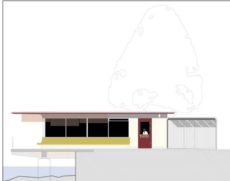
Vision Wartehäuschen: Die Wartehalle soll mit analogen Materialien aus der Erstellungszeit nachgebaut werden. Hinzugefügt werden Sonnenschutz-Rollos, die Fassade bekommt ihre ursprüngliche Farbigkeit in Eierschalen-Kalkfassung mit rotem Dachrand und türkisroten Metallbauteilen.

Es ist kein Bistro der «normalen» Art, das dort betrieben werden könnte. Da es weiterhin ein Wartehäuschen sein wird, darf es dort keinen Konsumzwang geben. Rein wirtschaftliche Beweggründe für den Betrieb kann man getrost vergessen. Es wird keine Garküche eingebaut, die bestehenden Nasszellen werden zu einer Kleinküche umgerüstet, und es wird einen Anbau auf der Ostseite des Hauses für Gastro-Nebenzimmer und eine neue öffentliche WC-Anlage geben. Die Betriebszeiten sind aus Rücksicht auf die Anwohner begrenzt, um 22 Uhr muss jeweils Schluss mit lustig sein. Gemeinderat Ludwig Näf, ver-