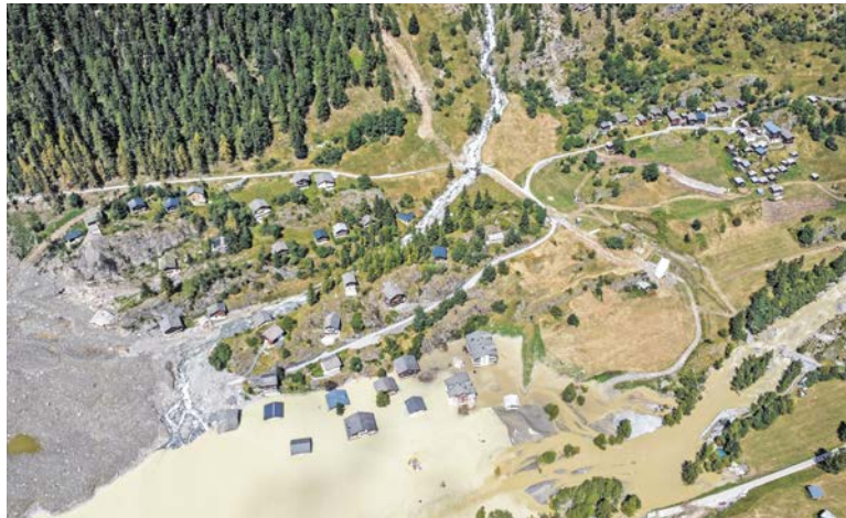
100 000 Franken für Blatten: Küsnacht unterstützt eine breite Palette an Hilfsorganisationen.

Die höchsten Beträge der Inlandhilfe entfielen auf das Küsnachter TAXI (CHF 66 161) sowie auf die Partnergemeinde Saas-Balen (CHF 50 000), der Küsnacht bei der Bewältigung von Unwetterschäden im Vorjahr geholfen hatte. In der Auslandhilfe ging der höchste Betrag nach Haiti: Mit 30 000 Franken wurde dort der Lohn eines Kinderarztes finanziert. Welche Organisation wie viel Geld erhält, entscheidet der Vergabeaus-