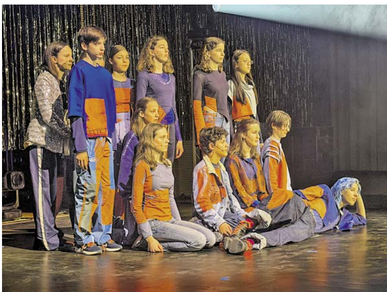
Performativ: Die musiktheatralische Inszenierung der Schülerinnen und Schüler in der HesliHalle.

stresst hat, oft unüberlegt und nicht sehen wollend, welches Chaos man damit in jungen Köpfen anrichtet. Was genau in denen vorgeht, wurde dann in der HesliHalle in einer grossartigen Theaterproduktion dargestellt. Das ganze Leben, von der Geburt bis zur Adoleszenz, vom unbekümmerten Kleinkind bis zur im Strudel der digitalen Berieselung verlorenen Generation. Chapeau für die schauspielerische Leistung aller Darstellerinnen und Darsteller, für das hochkarätige Schülerorchester, den stimmigen Chor und natürlich die vielen Personen, die Licht, Dramaturgie, Ton, Choreografie, Regie und Skript verantwortet haben. Schon einer der Räume, eine Installation, eine Performance oder nur das Theater wären eindrücklich genug gewesen; das Gesamtwerk aber ist ein kultureller Beitrag, wie er gewinnbringender und einprägsamer nicht hätte sein können.