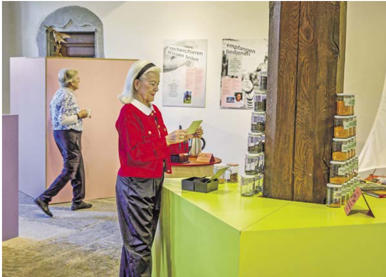
Einblick in die Ausstellung «Gemeinsam wirksam» mit zwei Freiwilligen des Museumsteams.

Die Sonderausstellung «Gemeinsam wirksam. Freiwilliges Engagement in Küsnacht» im Ortsmuseum Küsnacht wird aus aktuellem Anlass bis am 24. Mai verlängert: Die Vereinten Nationen haben das Jahr 2026 zum Internationalen Jahr der Freiwilligen ausgerufen. Ein weltweiter Anlass, um die Menschen zu würdigen, die sich freiwillig für andere einsetzen.