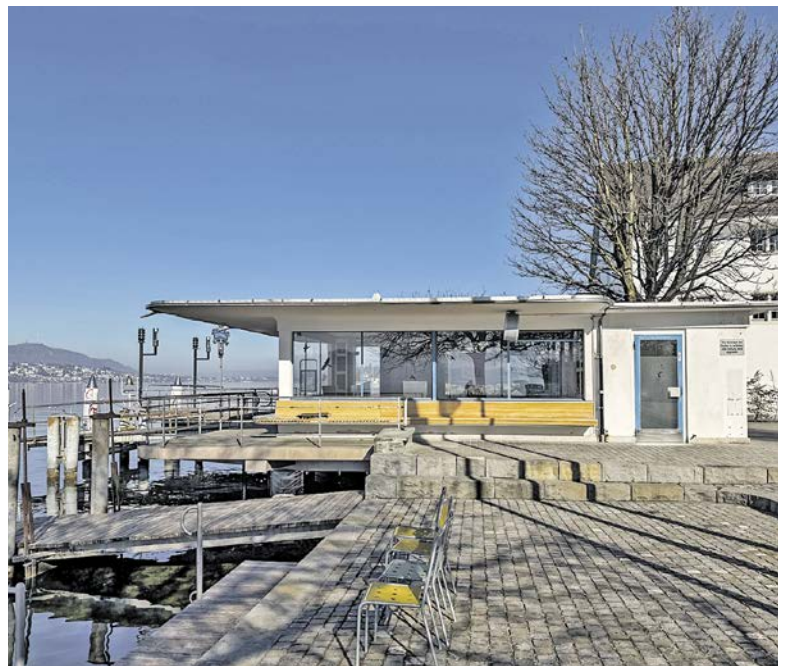
Nicht mehr lange: Das Wartehäuschen an der Schiffflände im Ist-Zustand, bald beginnen Sanierungsarbeiten.

Die Idee ist nun, das Wartehäuschen wieder gastronomisch und auch kulturell zu nutzen. Bislang gab es mehr oder weniger erfolgreiche Versuche, das Objekt zu beleben. Mal durch den Gastronom