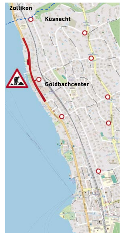
Der Abschnitt der Seestrasse, der saniert wird. Aktuelle Informationen zu der Baustelle sind unter https://l.ead.me/seestrasse1 zu finden. (Grafik: zvg)

■ KÜSNACHT. Weil sich die Strasse in einem schlechten Zustand befindet, muss sie saniert werden. Das teilt das Tiefbauamt des Kantons Zürichs mit. Die Bauarbeiten erfolgen in Etappen und beginnen am Montag, 9. März. Der Verkehr wird ab 16. März mit einem Lichtsignal einspurig durch den jeweiligen Baubereich geführt. Es ist vor allem im Morgen- und Feierabendverkehr mit Wartezeiten zu rechnen. Die Fussgängerinnen und Fussgänger können den jeweiligen Bauabschnitt auf der signalisierten Umleitung jederzeit passieren.