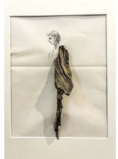
«Doch, es gibt Engel!»: Ein Stück Holz verleiht der Frau Flügel.

■ ERLENBACH. Ihre fantasievollen Collagen basieren auf alten Frauenskizzen. Es sind Zeichnungen, die sie zufällig in einer Altpapiersammlung im Dorf entdeckt hat. Diese vergessenen Bilder, ursprünglich dem Wegwerfen geweiht, erhalten durch ihre Arbeit ein neues Leben: ein Recycling der besonderen Art. Die Collagen bestehen aus Fundgegenständen, die ebenfalls ihre eigene Geschichte haben: Fragmente von Holz, Baumrinde, Pflanzen, Schmuck, Papier, Federn oder sogar Uhrenbestandteile – Dinge, die einst Teil eines Ganzen waren und nun in einem neuen Zusammenhang sichtbar werden. Ein Fest der Weiblichkeit, jedes Werk erzählt eine Geschichte. «Lost & Found» ist eine Hommage an das Vergessene, das eine neue Bedeutung und Identität findet. Die Aus-