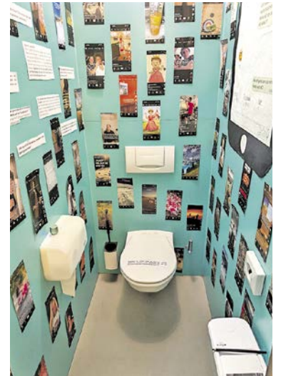
«Alles muss raus»: Die 4e lud dazu ein, das «stille Örtchen» in sechs unterschiedlich gestalteten WCs neu zu entdecken.

Am Schluss der «Tour de Kanti» wurden die Zuschauerinnen und Zuschauer zusammengeführt und entlang einer beleuchteten Spur zur HesliHalle geleitet. Beidseits der Lichtbänder standen Schülerinnen und Schüler, die über Handys oder Boomboxen Wort- und ohrenbetäubende Musikketzen abspielten. «Hör auf zu gamen!», hörte man da in Dauerschleife, «Du bist zu dünn!», «Füttere die Katze!», «Geh zur Schule!», «Mach deine Aufgaben!», «Mach die Matura!», «Du bist zu dick!». Man ertappte sich als Erwachsene dabei, schuldbewusst zu realisieren, dass man die eigenen Kinder genauso ge-