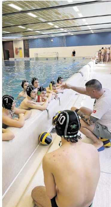
Schwimmen oben auf: Die Nachwuchsspieler von Aquastar.