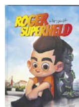
Kleine Auflage: Roger Superheld (Selbstverlag).