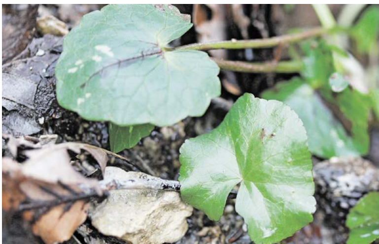
Schwer zu unterscheiden: links oben das essbare Scharbockskraut, rechts unten die giftige Sumpfdotterblume.

Allein zu wissen, was es hier alles zu entdecken gibt, verändert den Blick für die Natur. Beim nächsten Waldspaziergang lohnt es sich also, genauer hinzuschauen.