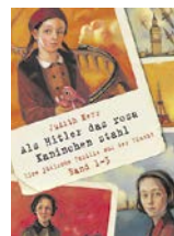
Wurde 2019 verfilmt: Als Hitler das rosa Kaninchen stahl von Judith Kerr (Ravensburger Verlag).