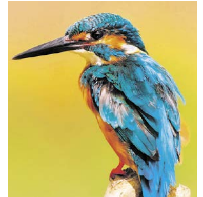
Der Eisvogel trägt seinen Namen wahrscheinlich wegen seiner schimmernden, blauen Farbe. Das althochdeutsche Wort «isarnfagal» kann mit «Eisvogel» oder «schillernder Vogel» übersetzt werden.

sind verschmutzte Gewässer oder Verbauungen von Uferbereichen. Der farbenprächtige Vogel wird manchmal auch in Küsnacht im Tobel oder in den angrenzenden Gemeinden gesichtet. Allerdings sind unsere Gemeinden nicht sein klassisches Verbreitungsgebiet. Im Kanton Zürich können sie am ehesten an der Thur, am Rhein oder an der Töss beobachtet werden. Am meisten wurde er allerdings am Klingnauer Stausee im Aargau beobachtet.