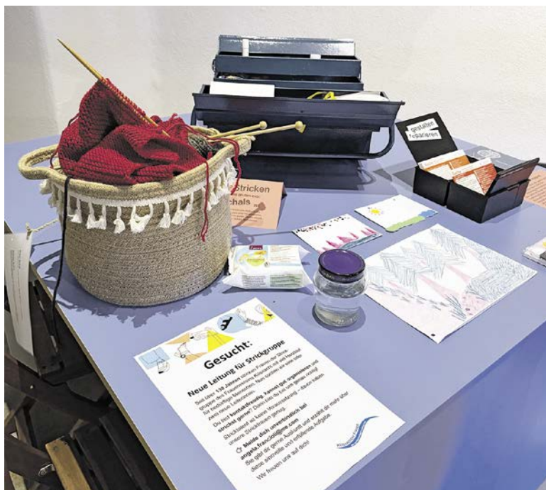
Ausprobieren: In der aktuellen Ausstellung im Untergeschoss des Ortsmuseums zum Thema Freiwilligenarbeit kann man selbst zur Nadel greifen.

Wenn man strickt, vergisst man schnell die Zeit, verfällt in eine Art rhythmisierten Rausch, in dem die Finger arbeiten, die Nadeln fliegen, der Faden fliesst. Es ist eine fast meditative Tätigkeit und ganz sicher ein barrierefreier Zugang zur inneren Ruhe. Und noch eine Erfahrung nimmt man mit aus den Gesprächen an diesem Nachmittag: Wer sich hier engagiert, engagiert sich auch sonst, im Dorf und privat natürlich. Und man hilft sich. Masche für Masche wird ein Netzwerk geknüpft, für das man keinen Computer, kein Handy und kein Internet braucht.