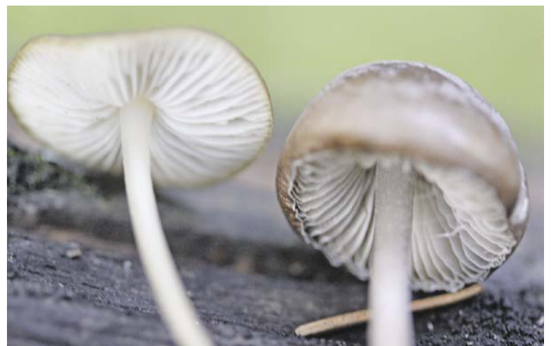
Links der essbare Fichtenzapfenrübling, rechts der ungeniessbare Fichtenzapfenhelmling.