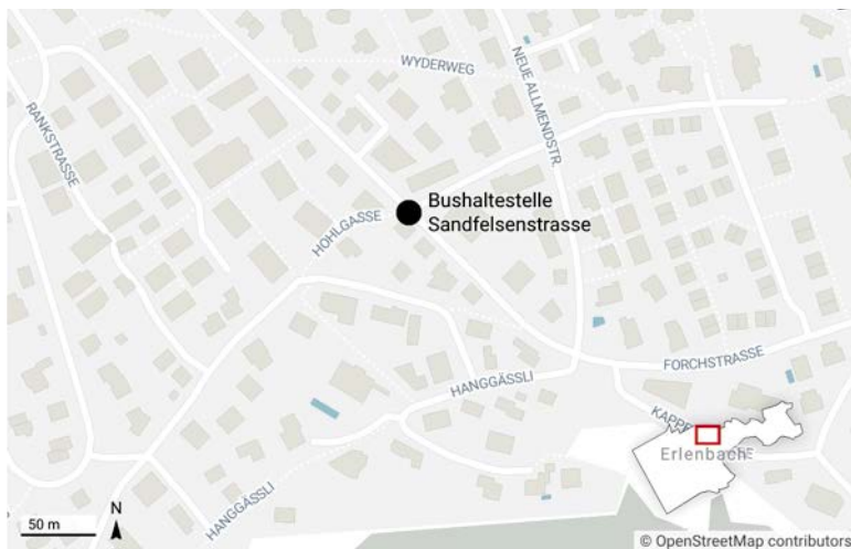
Der Unfall ereignete sich am Donnerstagabend, 5. März gegen 20 Uhr auf Höhe der Bushaltestelle Sandfelsenstrasse. (Grafik: bre)

Die Kantonspolizei Zürich sucht Personen, die sachdienliche Angaben zum Unfall, insbesondere zum beteiligten Auto machen können. Diese werden gebeten, sich mit der Kantonspolizei Zürich, Verkehrszug Hinwil, Telefon 058 648 65 90, in Verbindung zu setzen.