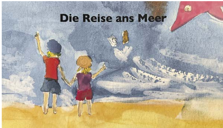
Die Reise ans Meer

Kinder fragen, Mama antwortet mit drei Büchern: Die Reise ans Meer (Selbstverlag), eines der drei Bilderbücher von Martina Peyer. (Bilder: zvg)