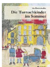
Begeistert junge Leser seit bald 100 Jahren: Die Turnachkinder (Oratio Verlag).