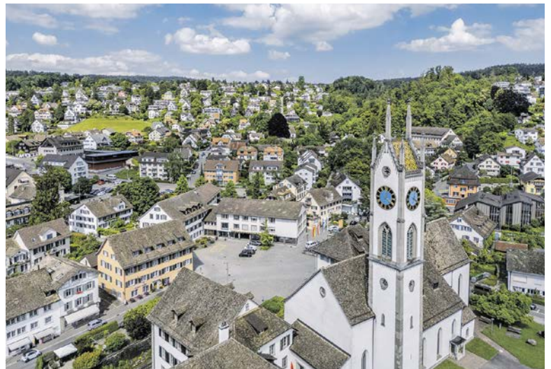
Unsere Gemeinden sind in den letzten dreissig Jahren vor allem in zwei Punkten gewachsen: in der Bevölkerung und in der Steuerkraft.

Untersucht man Küsnacht und Erlenbach mithilfe der zur Verfügung stehenden Grafiken, lässt sich Interessantes über die Bevölkerung herauslesen. So schrumpften oder stagnierten beide Bevölkerungen bis zur Jahrtausendwende. Ungefähr ab dem Jahr 2000 wuchsen beide wieder an. Diese Entwicklung lässt sich auch in der Stadt Zürich beobachten, die bis ins Jahr 2000 über 100000 Einwohner verloren hatte