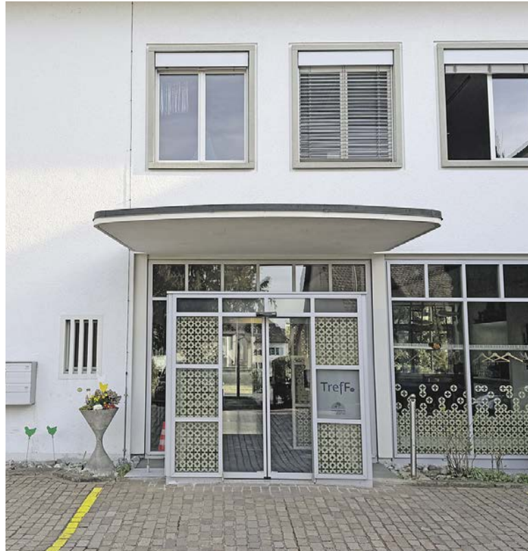
Während die Kinder spielen, kommen Eltern im «Flüügelpilz» ins Gespräch.