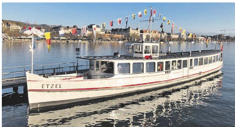
Die MS Etzel als Gipfelschiff auf dem Zürichsee unterwegs Richtung Bürkliplatz.