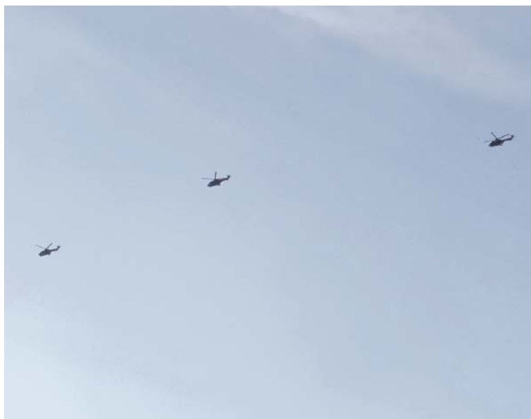
Tief und eng beieinander flogen die 16,8 Meter langen Helikopter der Schweizer Armee über die Goldküste.

die Piloten taktische Fähigkeiten wie Tiefflug, Navigation im Gelände oder Sichtflug.» Solche Übungen führe die Armee regelmässig durch, teils auch im Ausland. So hat sie etwa im vergangenen November in Schweden trainiert, da es dort mehr Platz und grosse, dünn besiedelte Gebiete gibt: «In der Schweiz ist es nur begrenzt möglich, sehr tief oder in der Nacht zu fliegen.» Auch der Einsatz von Täuschkörpern kann in der Schweiz nicht ohne Weiteres trainiert werden. Trotzdem müsse auch in der Schweiz geübt werden, erklärt Mathias Volken: «Trotz Ausbildungsaktivitäten im Ausland ist die Armee zur Stärkung ihrer Verteidigungsfähigkeit auf regelmässige Trainings in der Schweiz angewiesen.»