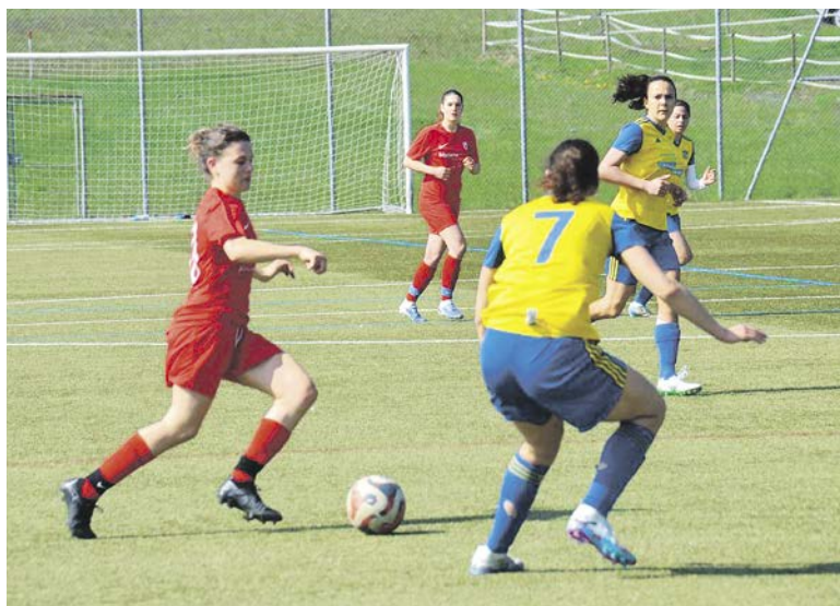
Viel Arbeit in der mittleren Zone des Platzes für beide Teams.