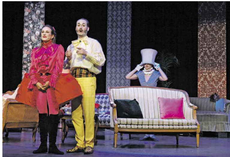
Liebeserklärungen ohne Blickkontakt.

■ KÜSNACHT. In der deutschen Fassung von Elfriede Jelinek zieht sich ein bitterböser österreichischer Schmäher durch den Text und verpasst Oscar Wildes Gesellschaftskritik eine zusätzliche Bissigkeit, die von der Schauspielgruppe «Die Kulisse» genüsslich ausgespielt wird. David Edmond kontrastiert die hochgestochene Sprache mit basslastigen Popsongs, fabulösen Kostümen und reichlich Attitüde. Auf der Bühne des katholischen Pfarreizentrums stehen barocke Sofas, üppig gepolstert, in unterschiedlichen Farben und Mustern. Eingeführt wird das Stück von einer weiblich gelesenen Figur mit flauschigem, roten Fächer, die sich als Oscar Wilde vorstellt. Es geht zurück in das viktorianische England, das geprägt ist von strengen Moralvorstellungen, einer rigiden Klassengesellschaft und einem scharfen Kontrast zwischen dem, was öffentlich gepredigt und dem, was hinter den Kulissen gelebt wird. Homosexualität ist nicht nur tabuisiert, sondern strafbar – ein Umstand, der wenige Monate nach der Uraufführung des Stücks «Ernst ist das Leben» in Oscar Wildes eigenem Prozess und seiner Verurteilung dramatisch