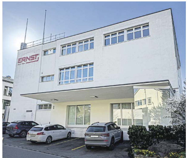
Soll bald eine Schuleinheit für 168 Schülerinnen und Schüler werden: Das Erdgeschoss des Gebäudes auf dem Areal Ernst, in dem jetzt noch eine Bank residiert.