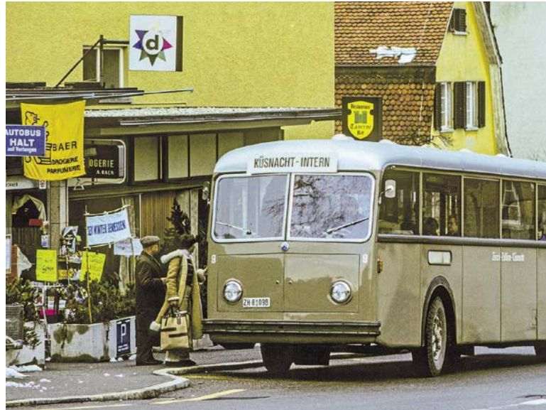
Ein Saurer/R+J Omnibus 5HP Nr. 9 von 1955, hier 1979 bei der Haltestelle Oberwacht – der heutigen Metzgerei – mit der charakteristischen blauen Signalisierung des AZZK.