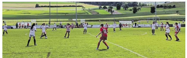
Das Terrain in Niederweningen machte es den Akteurinnen nicht immer einfach.

► Sonntag, 12. April, 11 Uhr; Sportplatz Fällacher; Meisterschaft; FC Küsnacht Frauen 1 – FC Niederweningen 1